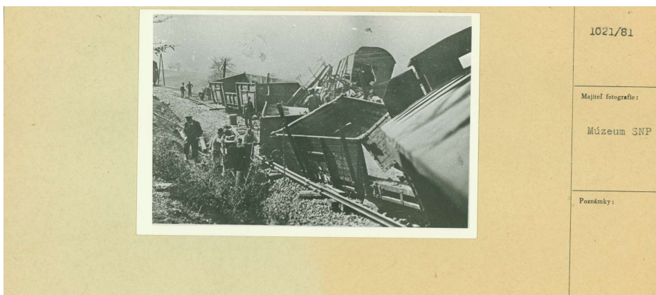
Fot. 2. Efekt akcji dywersyjnej przeprowadzonej w środkowej Słowacji w 1944 r. jeszcze przed wybuchem Słowackiego Powstania Narodowego Źródło: Múzeum SNP Banská Bystrica, Číslo negatívu: 1021/81