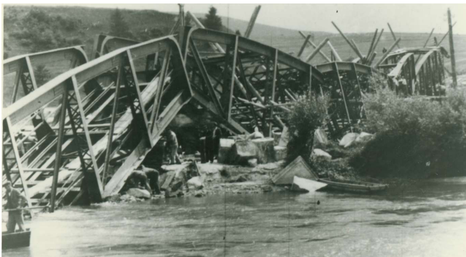
Fot. 1. Widok mostu kolejowego w Trnave wraz z wagonami po akcji dywersyjnej, 1944 r. Źródło: Múzeum SNP Banská Bystrica, Číslo negatívu: 583/67