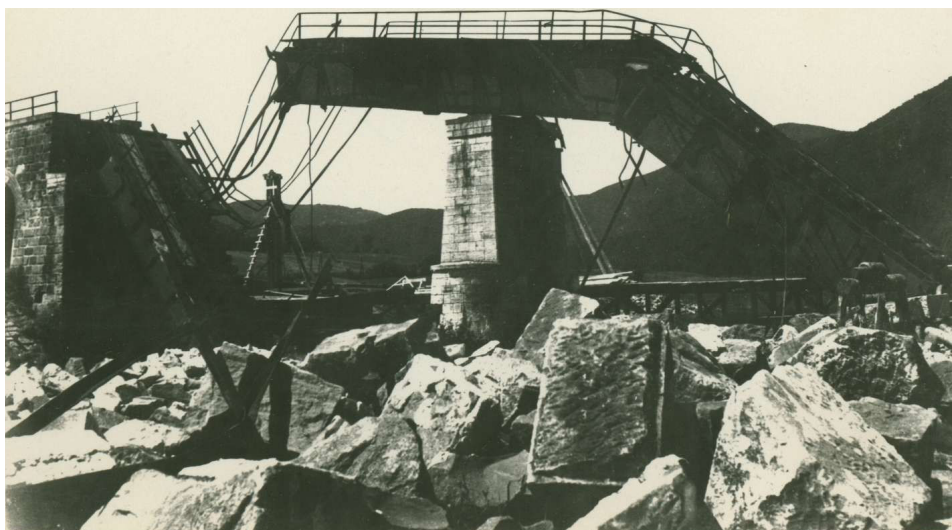
Fot. 3. Widok zniszczonego przez partyzantów słowackich mostu kolejowego na trasie Prešov–Kysak 1944 r.

Číslo negatívu: 4033