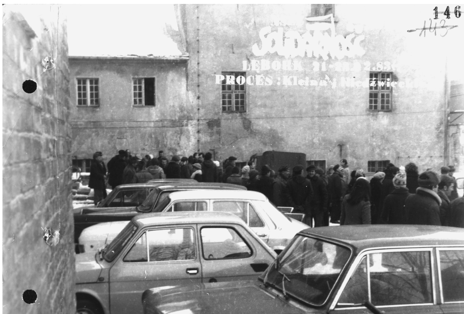
Fot. 3. Ulotka-zdjęcie wykonana po zwolnieniu Jana Niedźwieckiego i Edmunda Kleina