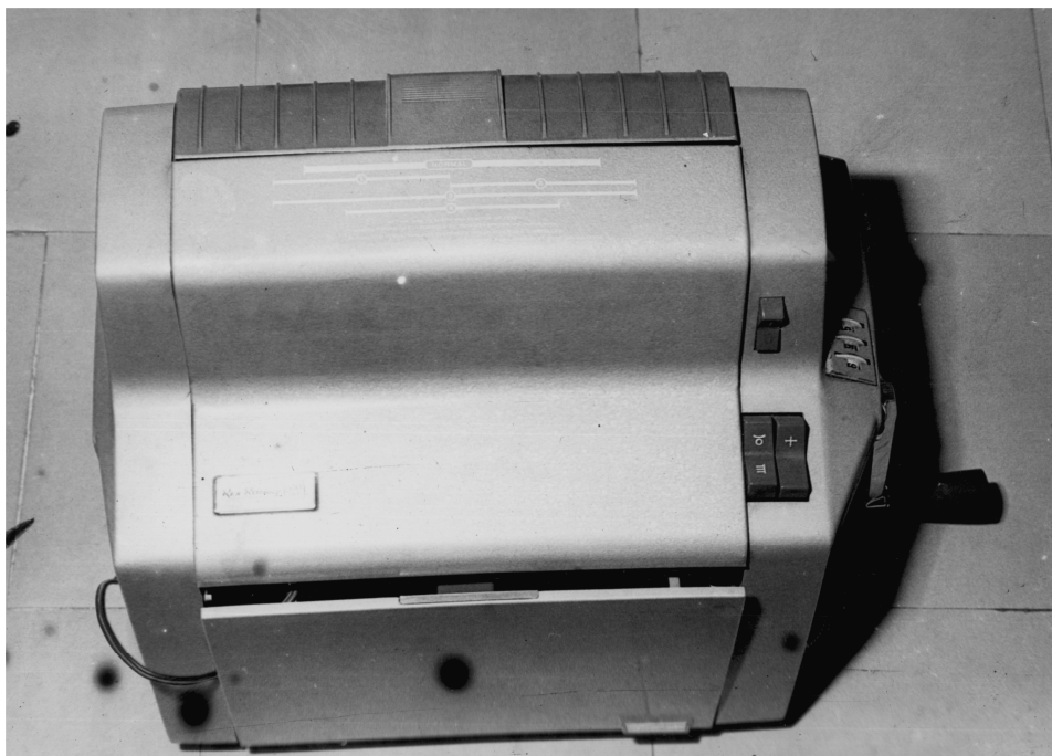
Fot. 6. Powielacz RKK NSZZ „Solidarność”, znaleziony 21 kwietnia 1981 r. przez funkcjonariuszy SB podczas rewizji