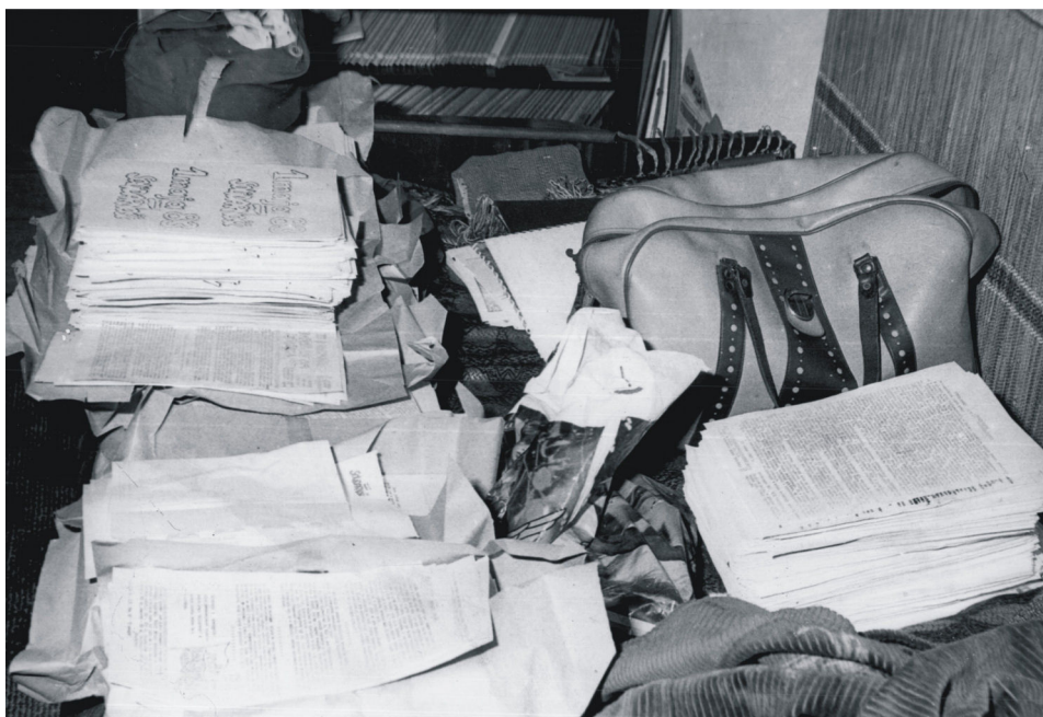
Fot. 7. Ulotki znalezione przez funkcjonariuszy SB w mieszkaniu Andrzeja Zajkowskiego