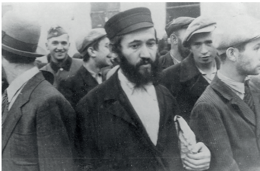
Fot. 6. Białystok, „Ostjude“