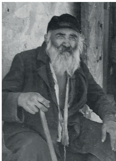
Fot. 7. Warszawa, „Ostjude“