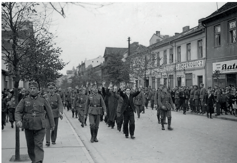
Fot. 17. O.u., vor der Hinrichtung

Auch hier sehen wir die letzten Momente im Leben der Juden, die zur Erschießung transportiert, in die Todesgruben geführt und in den Gaskammern der Konzentrationslager getötet wurden. Auch hier zeigt der Autor des Artikels Fotos unter den Nummern 17 bis 22, auf denen die deutschen Henker den Moment des Grauens, des Schreckens und des bevorstehenden Todes in Kameras festhielten.