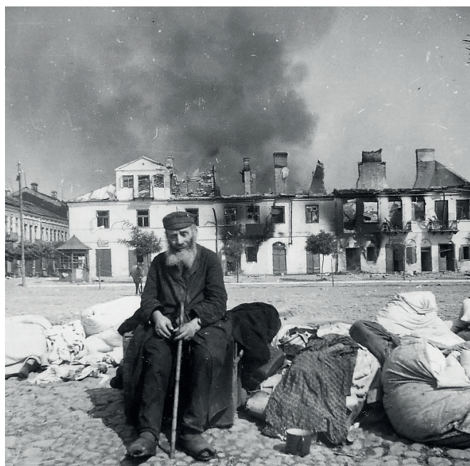
Fot. 8. Zwoleń, „Ostjude“