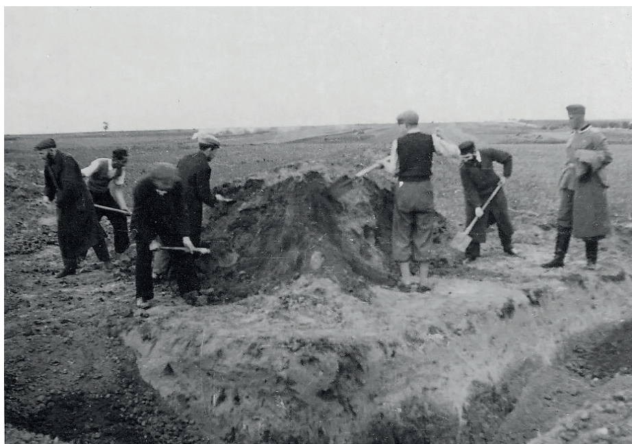
Fot. 20. O.u., vor der Hinrichtung