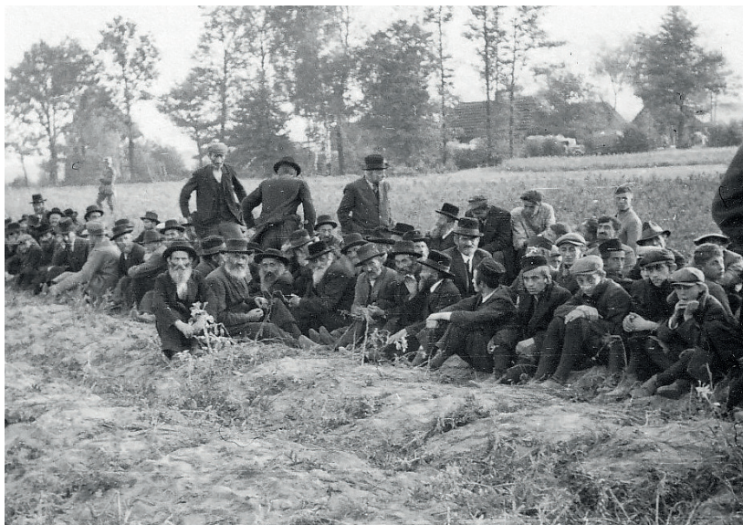
Fot. 18. Kolbuszowa, vor der Hinrichtung