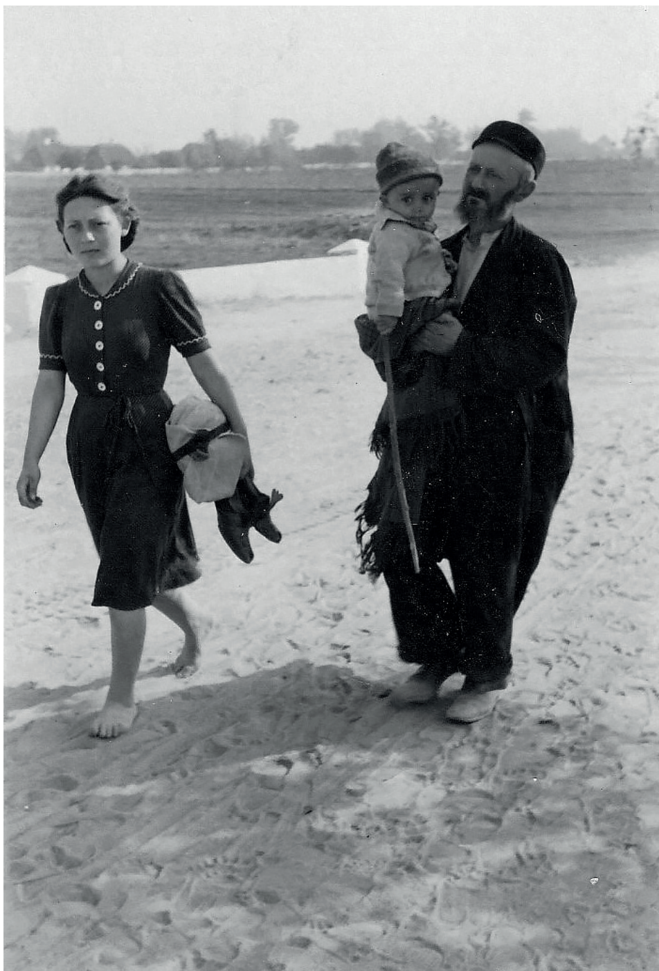
Fot. 2. Białystok, „Ostjuden“